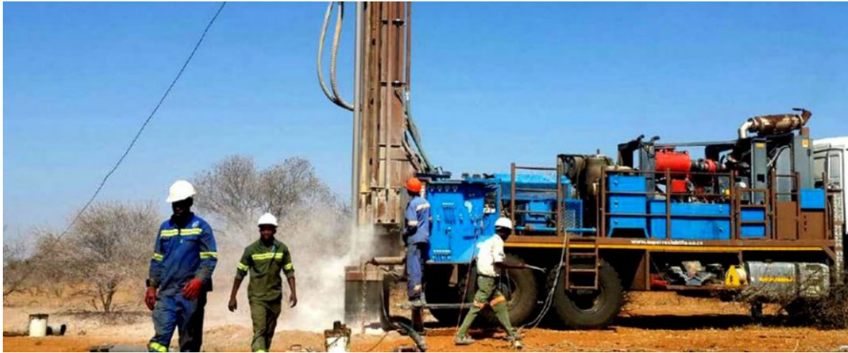
1.1. Imagem de um dos equipamentos de perfuração (plataforma) modernos, sofisticados e de alta pressão da AGUA DRILLING COMPANY- PERFURAÇÃO LDA.