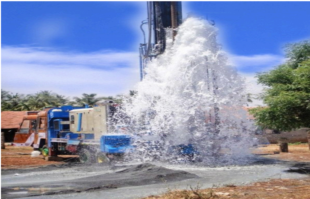
Perfuradores da Agua Drilling Company, no local perfurando um furo.

NIF 5000914932, Distrito urbano da Vila de Viana, Bairro Luanda Sul, Condomínio Ginga Renate, Rua Projecto Moral 11, Casa N° H3. Contactos telefônicos: +244 923838499/939684679, Email: aguadrillingangola@gmail.com